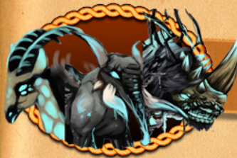
Mabaka, Jumbo, Crush